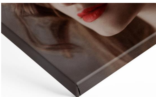
Motiv am Rand gespiegelt