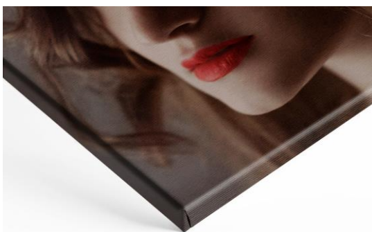
2 cm Keilrahmen

Der Leinwanddruck wird im Anschluss auf einen hochwertigen, mehrfach keilverzinkten Massivholz-Keilrahmen gespannt, welcher für ein einfaches Nachspannen mit Holzkeilen versehen ist. Das Motiv wird dabei am umgeklappten Rand gespiegelt, um zu gewährleisten, dass das gesamte Motiv auf der Leinwandfläche abgebildet ist.