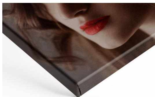
Motiv am Rand gedruckt